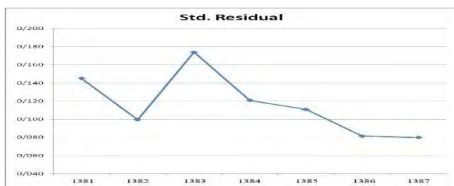
شکل (۳): روند ضریب تعیین متغیر قابلیت پیش‌بینی سود در طول زمان