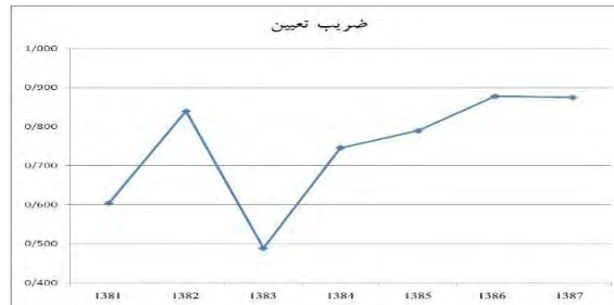
شکل (۲): روند ضریب تعیین متغیر سنجش پایداری سود در طول زمان

نتایج نشان می‌دهد مقادیر ضریب تعیین به جز سال ۸۳ روند افزایشی داشته است.