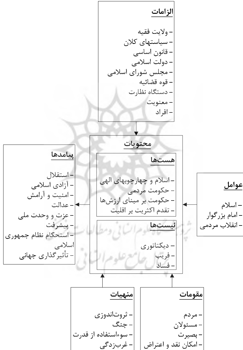
شکل ۲: الگوی مردم سالاری دینی

شکل ۲، الگوی مردم سالاری دینی را در سطح مقوله‌ها نشان می‌دهد. در ادامه، دسته‌های مختلف تشریح خواهد شد.