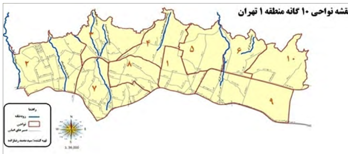
نقشه ۲: نقشه نواحی ۱۰ گانه منطقه ۱ شهر تهران و محلات