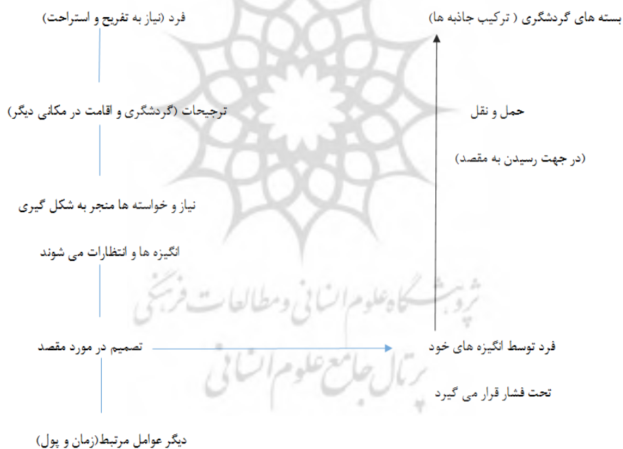
شکل ۲. سیستم جاذبه‌های گردشگری لیپر

جاذبه‌های انسان ساخت: به کلیه عناصر و پدیده‌های مصنوع دارای ارزش و جذابیت، جاذبه‌ی انسان ساخت گفته می‌شود (آشورت ۱ ، ۱۹۸۹). رویکرد تقاضا محور گردشگری برگرفته از این فرض است که "مقصد نشان دهنده‌ی احساسات، باورها و عقاید یک فرد است که برای او رضایت‌بخش بوده و نیاز او به داشتن یک تعطیلات خاص را برآورده می‌سازد" (هو و ریچی ۲ ، ۱۹۹۳). مایو و جارویس ۳ (۱۹۸۱)، پیشنهاد می‌کنند که جذابیت بسته‌های گردشگری تابعی از منافع ادراک شده توسط بازدیدکنندگان است. این رویکرد توسط لیپر ۴ (۱۹۹۰) در قالب مدلی از یک سیستم جاذبه‌های گردشگری توسعه داده شده است و بیان می‌کند که گردشگرها به سمت یک جاذبه جذب یا کشیده نمی‌شوند، در حالی که توسط انگیزه‌ی خود به سمت مکان یا رویدادی که برایشان لذت‌بخش است کشیده می‌شوند (راستروپ ۵ ، ۲۰۰۹) (شکل ۲).