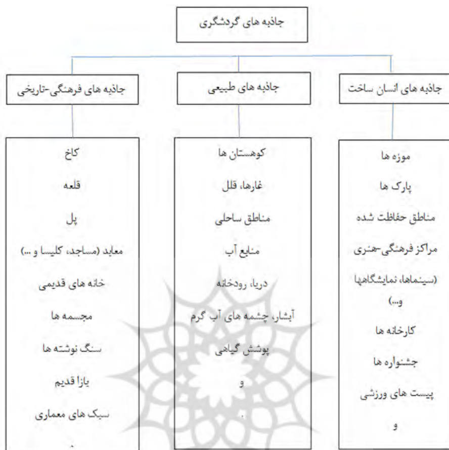
شکل ۱. جاذبه‌های مناسب گردشگری (سازمان جهانی گردشگری، ۱۹۹۹)

جاذبه‌های طبیعی: جاذبه‌های طبیعی موجود در مقصد، غالباً اولین موضوعی است که توجه گردشگر را جلب می‌کند که اصولاً ترکیب متنوعی از منابع طبیعی را می‌توان به منظور ایجاد محیطی جذاب برای توسعه گردشگری به کار گرفت.