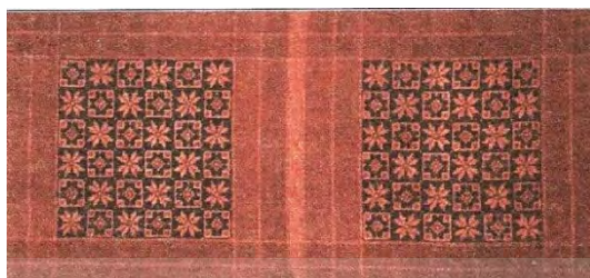
تصویر ۳- ایکات تلیا رومال (Crill, 1998)