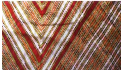
تصویر ۵- پارچه ی لهریا از مجموعه ای خصوصی (Ranjans, 2007; 86)