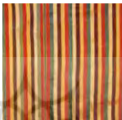
تصویر ۶- پارچه ی مشرو، گجرات هند، قرن ۱۸ میلادی (Wilson, 2011; 6)

دو مرکز تهیّه ی این پارچه، شهرهای پاتن و مندوی می باشد. (Ibid) ایکات تاری در سوریه و ترکیه، مشرو نامیده می شود. (Yulo, 2015; 27) تصویر ۶، نمونه ای از این پارچه است.