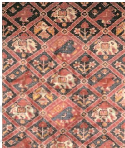
تصویر ۱- ساری ابریشمین پاتولا، گجرات هند، اواخر قرن ۱۹ و اوایل قرن ۲۰ میلادی، عرض: ۱۵۴ اینچ و ارتفاع ۵۲ اینچ. (همان جا)

هایی که به طور محلی از ایکات تار تزیین می شوند، کاربردهایی نظیر لباس، تشریفات مذهبی، تبادل هدیه و بازرگانی دارند که هنوز دربردارنده ی موتیف های پاتولا هستند. (Saunders, 2012; 13) تصویر ۱، نمونه ای از ایکات دوگانه ی پاتولا با تصاویر فیل، طوطی و دختران رقصنده و گل ها در شبکه ای الماسی شکل است که در آن از پود فلزی طلا استفاده شده است. (Simcox, 2007; 20) با توجه به نمونه ها، رنگ های پاتولا عمدتاً قرمز، زرد، سبز، سفید و قهوه ای شاه بلوطی و طرح آن برگ، ستاره، موتیف های فیگوراتیو و شبکه های ضخیم با اشکال هندسی است.