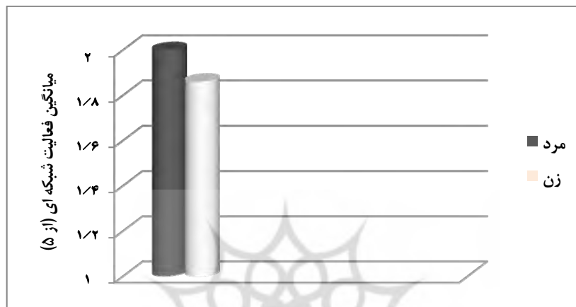
نمودار ۱. فعالیت شبکه‌ای کاربران بر حسب جنس

رابطه با دوستان فعلی و پیدا کردن دوستان جدید و فعالیت‌های غالب در رسانه‌های اجتماعی را تنظیم پروفایل، یادداشت گذاری، بررسی پروفایل دیگران و مشاهده نظرات دیگران گزارش کرده‌اند.