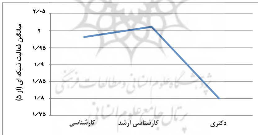
نمودار ۲. فعالیت شبکه‌ای کاربران بر حسب میزان تحصیلات