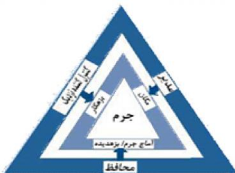
نمودار ۲- مثلث تحلیل مسئله (فلسن ۱۳۹۲: ۱۳۱)