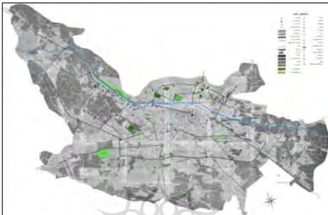
شکل ۳ - موقعیت باغ‌ها و پارک‌های شهری شهر شیراز