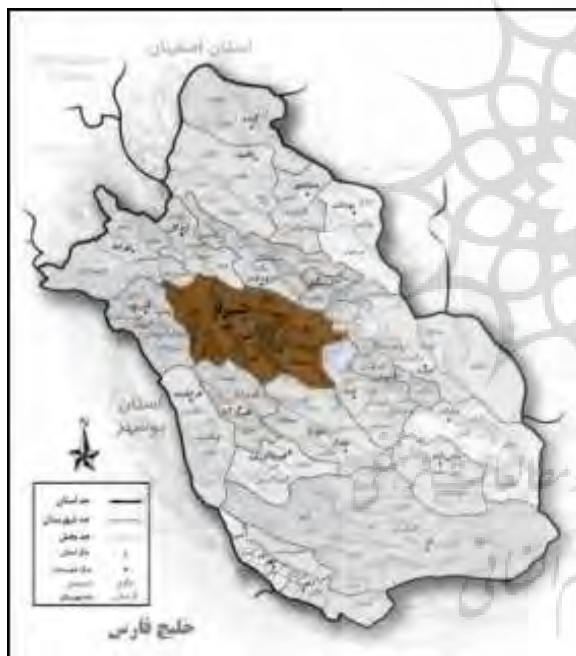
شکل ۲- موقعیت جغرافیایی شهرستان شیراز شکل