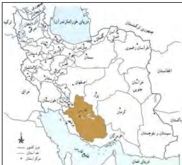
۱- موقعیت شهر شیراز در کشور و استان