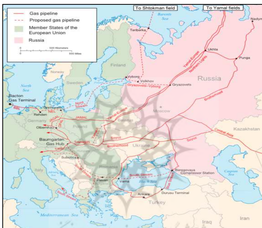
شکل شماره ۳: اصلی‌ترین خطوط لوله گاز طبیعی بین روسیه و اروپا ۲

در ادامه به اقدامات دیگر روسیه و اروپا در مورد این مناقشه پرداخته می‌شود. شکل شماره ۳ اصلی‌ترین خطوط لوله گاز طبیعی بین روسیه و اروپا را نشان می‌دهد. خط لوله جریان شمالی ۱ هم‌اکنون ساخته شده است.