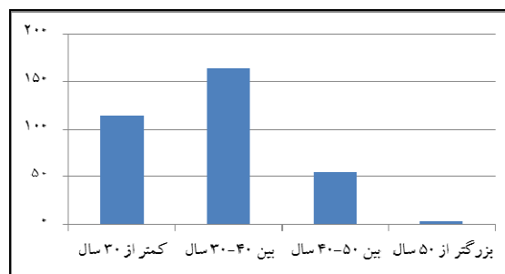
شکل ۲ فراوانی توزیع پاسخ دهندگان براساس سن

نتایج تحلیل عاملی مقیاس مورد استفاده در جدول ۳ ارائه شده است. بار عاملی مشاهده شده در تمامی موارد مقداری بزرگتر از 0/3 دارد که نشان می‌دهد همبستگی بین متغیرهای پنهان (ابعاد هر یک از سازه‌های اصلی) با متغیرهای قابل مشاهده قابل قبول است. پس شناسایی همبستگی متغیرها، آزمون معنی داری صورت گرفت. جهت بررسی معنی دار بودن رابطه بین متغیرها از آزمون تی (T-test) استفاده گردید. چون معنی داری در سطح خطای 0/05 بررسی می‌شود بنابراین اگر میزان بارهای عاملی مشاهده شده با آزمون t -value از 1/96 کوچکتر محاسبه شود، رابطه معنی دار نیست. براساس نتایج مندرج در جدول ۴ شاخص‌های سنجش هر یک از مقیاس‌های مورد استفاده در سطح اطمینان 0/5 مقدار آماره t -value بزرگتر از 1/96 است که نشان می‌دهد همبستگی‌های مشاهده شده معنی دار هستند.