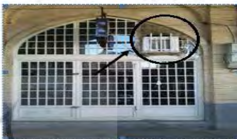
نمایی از پنجره و میستم سرمایشی در بازارچلقا