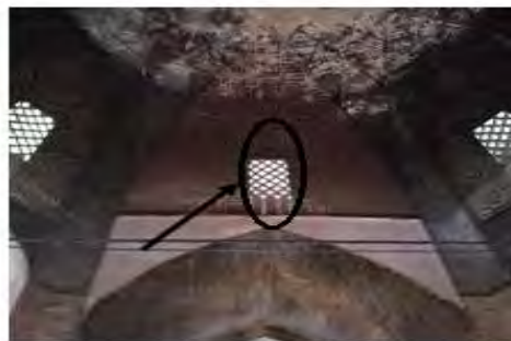
نمایی از پنجره‌ی مشبک در بازار قیصریه