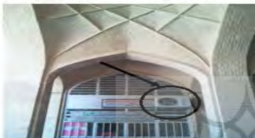
نمایی از پنجره و میستم تهویه در بازار حاج محمد علی