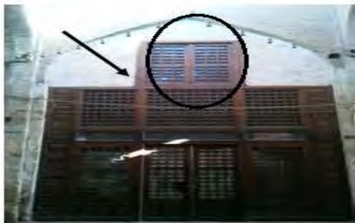
نمایی از پنجره‌ی مشبک در بازار حسن‌آباد