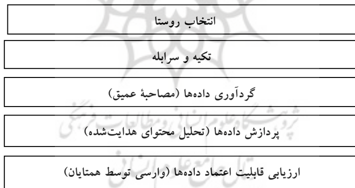
شکل ۲- مراحل روش تحقیق

بازخوانی دست‌نوشته‌های جمع‌آوری‌شده، عملیات کدگذاری و انطباق آنها با مقوله‌های مدل مفهومی انجام شد. برای روایی (۹) و اعتبارسنجی یافته‌های تحلیل محتوا شیوه‌های مختلف معرفی شده است که از مهم‌ترین آنها می‌توان به واریسی توسط همتایان یا همکاران (۱۰) ، درگیر بودن با موضوع به مدت طولانی (۱۱) ، مشاهده مستمر و موازی (۱۲) و سه-گوشه‌سازی (۱۳) اشاره کرد (Lincoln and Guba, 1985; Manning, 1997). در مطالعه حاضر، از روش واریسی توسط همتایان استفاده شد. بدین منظور، پس از مکاتبه با تعدادی از صاحب‌نظران توسعه روستایی، روایی نتایج به دست آمد. مراحل روش تحقیق حاضر در شکل ۲ آمده است.