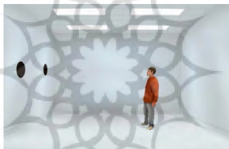
شکل ۱. نمونه‌ای از تصاویر به کار رفته در آزمون. به ترتیب از پایین به بالا دیدگاه مساوی، ناقص و مشابه کاراکتر نسبت به آزمودنی.