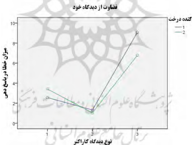
شکل ۴. نمودار تعاملی دیدگاه کنده درخت در موقعیت قضاوت از دیدگاه خود.

باوجود کنده نشان نداد. نتایج آزمون تی همبسته در جدول ۳ قابل مشاهده است.