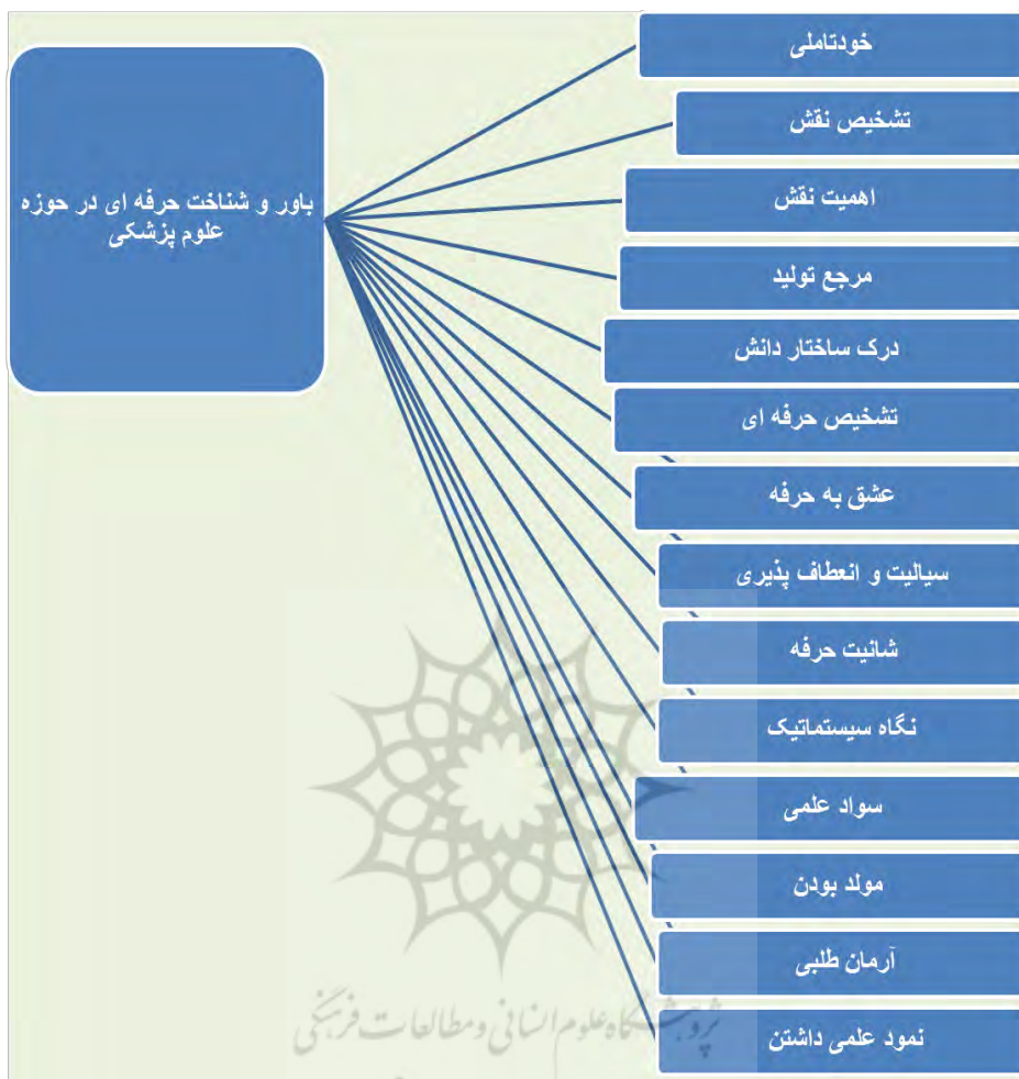
شکل ۱- مؤلفه های شناخت و بایور حرفه ای در حوزه ی علوم پزشکی