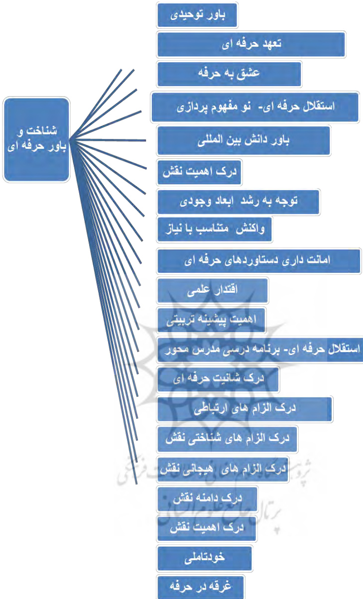
شکل ۳- مؤلفه های شناخت و باور حرفه ای در حوزه ی علوم انسانی