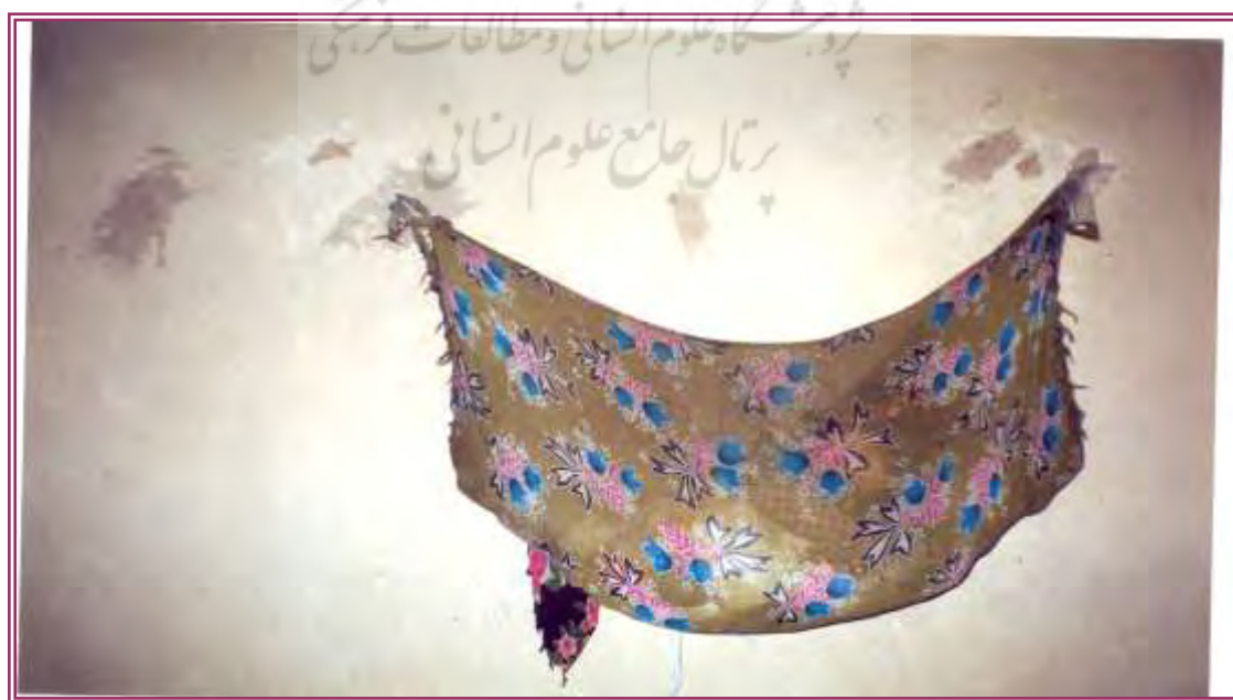
تصویر ۳- ابزار مورد استفاده پرخوان

توبره پرده‌ای: پارچه‌ای است که از چهار گوشه به دیوار آویزان است. بیماران موظفند که نشانی از خود مانند تکه‌ای پارچه از لباس، عکس و ... را در داخل آن بیندازند. در طی اجرای مراسم پرخوان چندین بار به طرف توبره رفته و لحظاتی را در آنجا درنگ می‌نماید. پرخوان معتقد است که لشکر اجنه در اطراف توبره تجمع می‌نمایند و این عمل برای آن است که نوع بیماری و راه معالجه افراد را از اجنه سوال نماید.