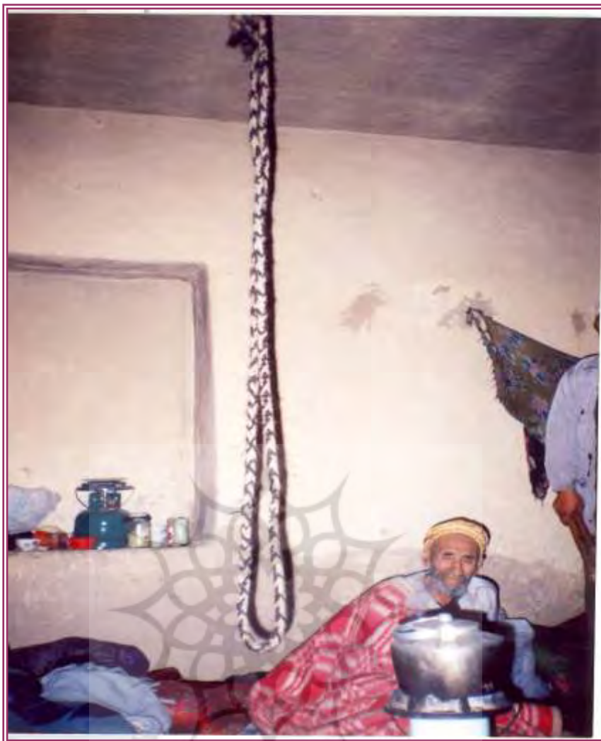
تصویر ۴- قولونگ یا طناب که از سقف محل اجرای مراسم پرخوانی آویزان است، منزل رجب پرخوان روستای یئل چشمه

بدین صورت که اگر از دستش کاری بر بیاید به آنها اظهار امیدواری می‌دهد و طول مدت زمانی که بایستی در آنجا بمانند را مشخص می‌نماید و به برخی که نمی‌تواند آنها را معالجه کند می‌گوید تا چاره‌ای دیگر اندیشند.