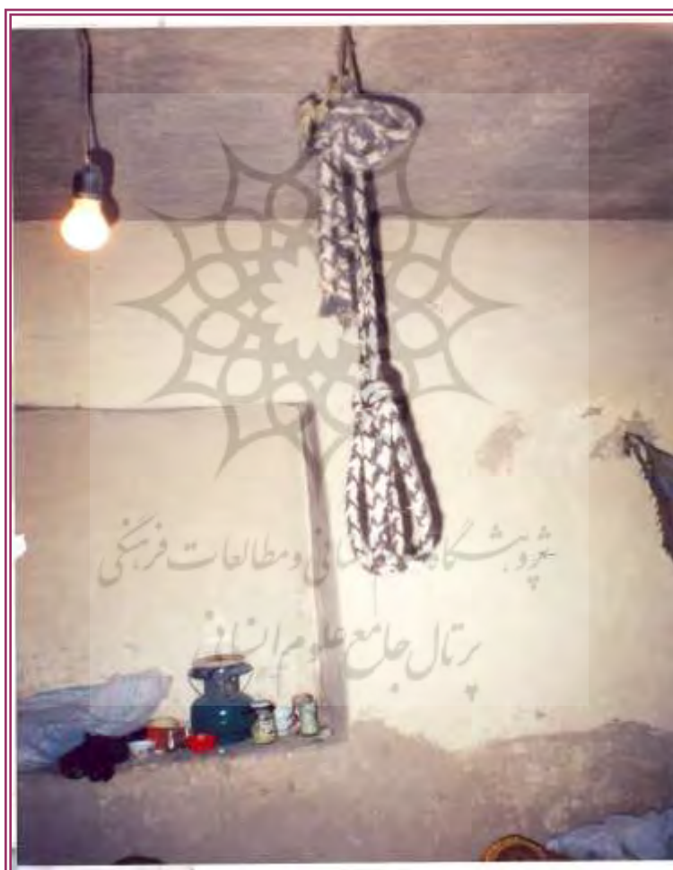
تصویر ۳ - طناب در حالت بسته بودن، منزل رجب پرخوان، روستای ٹیل چشمه،

پرده‌ای بیندازند، سپس منتظر اقدامات و جواب پرخوان بمانند تا وی نوع مریضی وی را با دریافت علائمی از لشکر اجنه، - بدین وسیله که هنگام اجرای مراسم پرخوانی، پرخوان چندین بار به نزدیک توبره رفته و وضعیت بدنی، روحی و بیماری تک تک بیماران را از اجنه و آل‌های خود دریافت کرده ۱ مشخص و اقدامات استعلاجی و درمانی وابسته به نوع بیماری را انجام می‌دهد، ۱ و در پایان مراسم پرخوانی و هنگام دعا نویسی، پرخوان به مریض‌ها و مراجعین جوابی که از لشکر اجنه خود گرفته را به بازگو می‌کند.