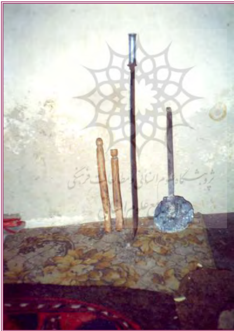
تصویر ۲ - ابزار مورد استفاده پرخوان

گروهی از لشکر اجنه پرخوان، به گروه آتش پرست معروف هستند، به همین سبب کفگیر را در آتش اجاق گذارده و آن را به صورت گداخته در می آورند. پرخوان معتقد است فردی که دچار پا درد یا ناراحتی دست شده جن یا ارواح پلید باعث آسیب به دست و پای او شده‌اند و یا این که در آنجا نفوذ نموده‌اند. بهمین سبب پرخوان با کفگیر گداخته در آتش به آن قسمت از بدن که درد دارد می‌زند تا با کمک گروه اجنه آتش پرست روح یا اجنه پلید از آن قسمت از اعضای بدن خارج شده و باعث معالجه بیمار شود. امروزه به جای کفگیر گداخته از کفگیر داغ شده در بخاری نفتی استفاده می‌نمایند.