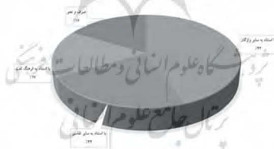
نمودار ۳: موارد تفسیر ادبی المیزان ذیل آیات سوره غافر

نمودار شماره ۳ نیز، موارد مختلف تفسیر ادبی المیزان ذیل سوره غافر را نشان می‌دهد که براساس آن، علامه در ۳ مورد از فرهنگ واژگان عربی و در ۴ مورد از سایر تفاسیر بهره برده است، ۸ مرتبه نیز از اجتهادات شخصی خویش استفاده کرده و بدون ارجاع به منبع یا کتاب خاصی، معانی واژگان را با کمک سایر واژگان مرتبط با آن بیان نموده است. همچنین ایشان در ۳ مورد نیز با کمک قواعد و مباحث صرف و نحو زبان عربی، به تبیین معنای آیه و ریشه‌یابی واژگان آن پرداخته است.