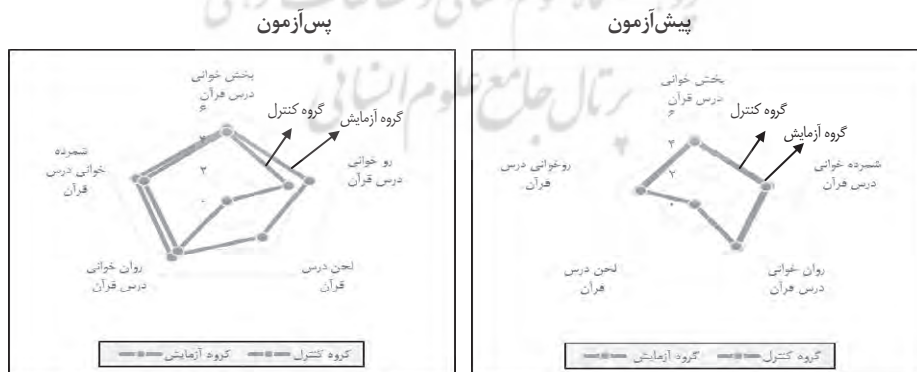
نمودار ۲: مقایسه نمرات گروه آزمایش و گروه کنترل در پیش آزمون و پس آزمون

در نمودارهای بالا، مقایسه پیش آزمون و پس آزمون نمرات قرآن انجام شده بود، اما می‌توان برای تکمیل این قسمت مقایسه بین دو گروه آزمایش و کنترل را انجام داد. نموداری که در پی می‌آید در واقع شکل دیگری از مقایسه مطالب پیشین است و به درک بهتر تفاوت‌ها کمک می‌کند. در این نمودار، نمرات پیش آزمون و پس آزمون به تفکیک دو گروه ارائه شده است. ملاحظه می‌شود که در نمودار پیش آزمون، میانگین نمرات هر دو گروه تقریباً مشابه است و تفاوتی دیده نمی‌شود (خطوط نمودار بر یکدیگر منطبق شده‌اند)، اما نمودار دوم، به‌طور واضحی نشان می‌دهد که میانگین نمرات دانش‌آموزان گروه آزمایش در همه بخش‌های روخوانی بیش از میانگین نمرات گروه کنترل است. این تفاوت می‌تواند به دلیل دوره‌های آموزشی به‌عنوان متغیر مستقل تحقیق و یا به دلیل تفاوت اولیه دانش‌آموزان گروه آزمایش و گروه کنترل باشد. بنابراین، در معناداری تفاوت‌ها نیاز است تا اثر عوامل مؤثر در روخوانی قرآن در دو گروه حذف شود و تنها تغییراتی که به دلیل دوره آموزشی است، مطالعه شود. این کار از راه به‌کار بستن تکنیک‌های آماری مناسب میسر است که در ادامه بررسی می‌شود.