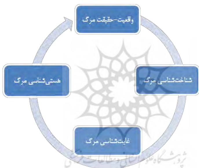
شکل ۳. فضای مفهومی «مرگ» در مثنوی معنوی

حاوی روایت‌های تحلیلی هنجاری در زمینه مرگ و مردن در گونه شعر حکمتی است. پس ترا هر لحظه مرگ و رجعتی است ۱ مصطفی فرمود دنیا ساعتی است [۱۱۴۵/۱] مرگ و جسک ای اهل انکار و نفاق ۲ عاقبت خواهد بدن این اتفاق [۲۱۹۲/۳] راه مرگ خلق ناپیدا رهیست ۳ در نظر ناید که آن بی جا رهیست [۲۶۲۵/۳] طوطی نطق و شکر بودیم ما ۴ مرغ مرگ اندیش گشتیم از شما [۲۹۵۱/۳] باری در این سرمتن فرهنگی فخییم نیز فضای مفهومی خاصی بر مرگ حاکم است که در الگوی پیش رو نشان داده شده است.