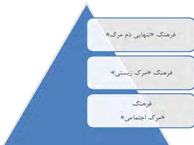
شکل ۱. الگوی جامع فرهنگ مرگ