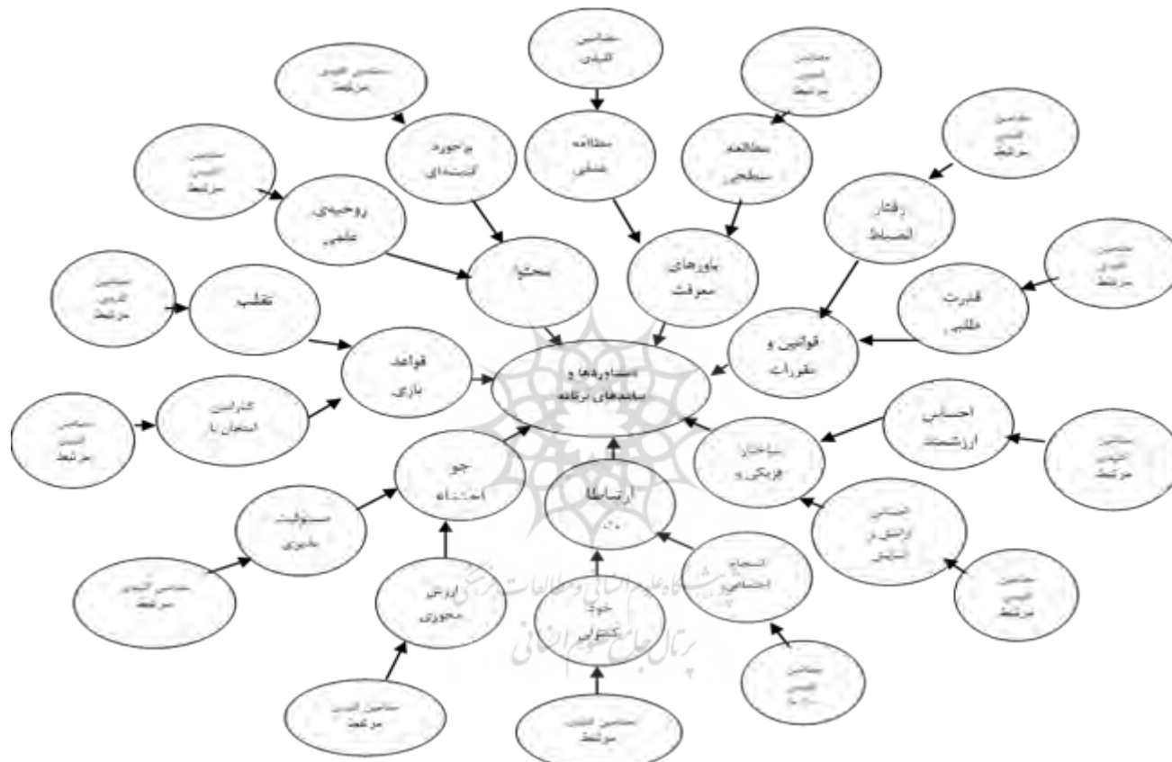
نمودار ۱. شبکه‌ی مضامین دستاوردها و پیامدهای برنامه‌درسی ضمنی دانشگاهی