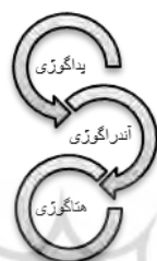
شکل ۱- زنجیره گوزی‌ها

سیر تکوین و شکل‌گیری مفهوم هتاگوژی را باید در ریشه‌های آندراگوژی دانست به‌طوری‌که این رویکرد را می‌توان به‌نوعی بسط و گسترش آندراگوژی قلمداد کرد. زنجیره یادگیری از پداگوژی به آندراگوژی و به هتاگوژی به‌عنوان بخشی از یک فرآیند آموزشی است که در آن مربی/تسهیلگر درحالی‌که توسعه مهارت‌های یادگیری در فراگیرندگان است (شکل زیر):