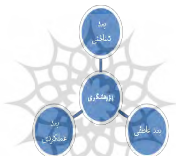
شکل ۱- ابعاد سه‌گانه؛ شناختی، عاطفی و عملکردی نگرش جامع پژوهشگری

بعد عملکردی نگرش جامع پژوهشگری: در این بعد، برنامه‌های درسی رشد دهنده نگرش پژوهشگری باید مهارت‌های عملی لازم برای فعالیت پژوهشی را رشد دهند. صاحب‌نظرانی چون آرتور (۲۰۰۰)، ماتیلا (۲۰۰۷)، کلیک (۲۰۰۹)، دینز (۲۰۱۰) بر خلق فرصت‌های عملی به‌منظور ایجاد زمینه‌های رشد مهارت‌های عملی پژوهشی تأکید داشته‌اند.