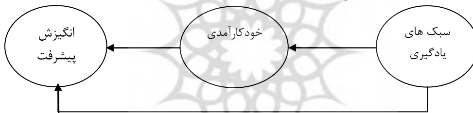
مدل مورد آزمون در این پژوهش

به طور خلاصه با توجه به نقش موثر خودکارآمدی و سبک‌های یادگیری بر انگیزش پیشرفت هدف از این مطالعه تبیین نقش واسطه‌گری متغیر خودکارآمدی برای سبک‌های یادگیری و انگیزش پیشرفت دانش‌آموزان دختر دبیرستانی شهرستان ابرکوه که در سال تحصیلی ۸۹-۹۰ مشغول به تحصیل می‌باشند در نظر گرفته شد.