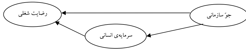
شکل ۲. مدل نظری مربوط به تأثیر جوّ سازمانی و سرمایه‌ی انسانی بر رضایت شغلی