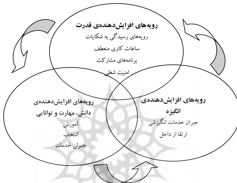
شکل ۱. رویه‌های عملکرد بالا (لیو و همکاران، ۲۰۰۷)

کارکنان برای تلاش می‌باشد. هم‌چنین، برنامه‌های مشارکت، ساعات کاری منعطف، رویه‌های رسیدگی به شکایات و امنیت شغلی، به‌عنوان رویه‌های افزایش‌دهنده‌ی قدرت طبقه‌بندی می‌شوند؛ زیرا آن‌ها موجب تسهیل فرایندهای کاری می‌شوند، موانع کاری را برطرف می‌کنند و کمک می‌کنند که کارکنان مهارت‌های‌شان را به‌کار گیرند (لیو و همکاران، ۲۰۰۷).