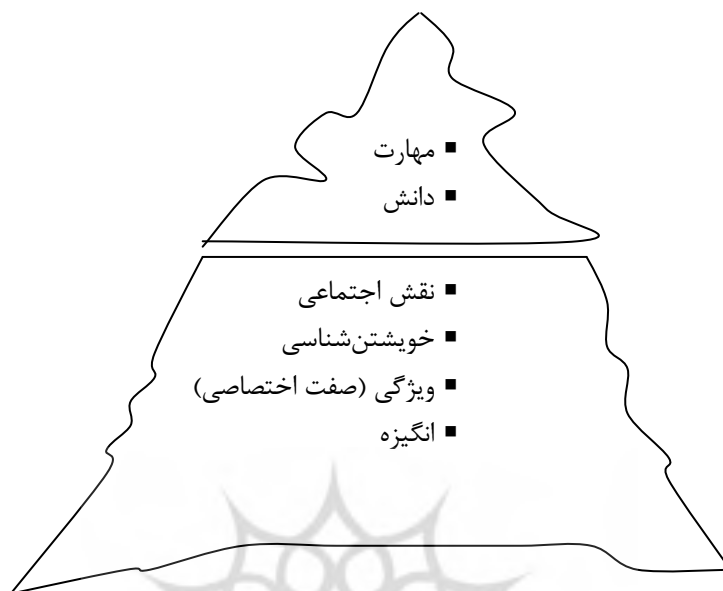
شکل ۱. مدل کوه یخ شایستگی‌های مدیریتی