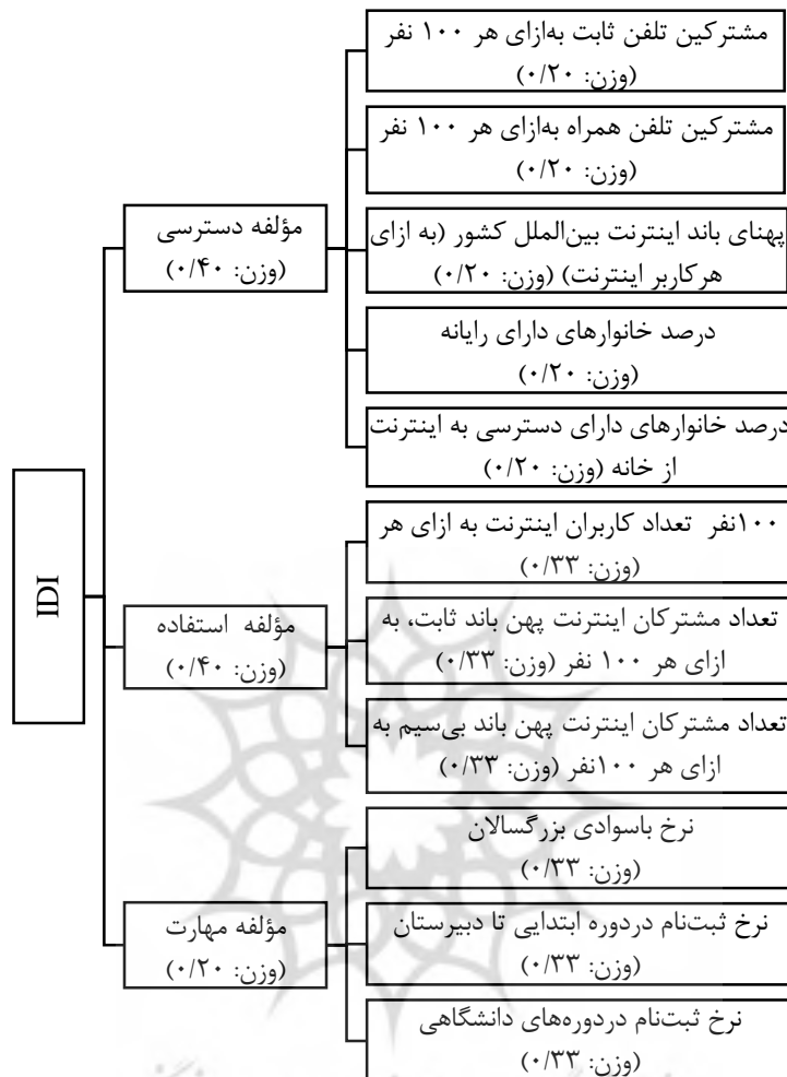
شکل (۱): IDI و مؤلفه های آن