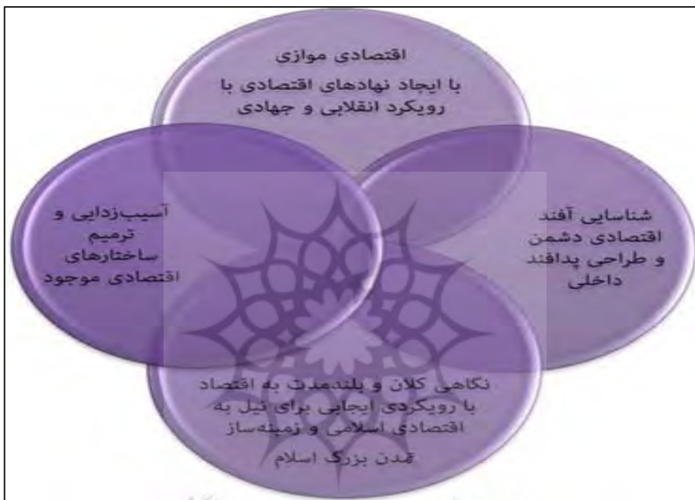
نمودار ۱. مدل اقتصاد مقاومتی بر اساس قابلیت‌های آن برای اقتصاد ایران

مقوله است که اقتصاد مقاومتی مشتمل بر اقتصاد کارآفرینی و ریسک‌پذیری و نوآوری می‌شود. البته همه این چهار تعریف از اقتصاد مقاومتی به نوعی با هم رابطه عموم و خصوص من وجه دارند، منتها برخی کوتاه‌مدت و برخی بلندمدت هستند و البته ترکیبی از استراتژی‌های مطلوب را نیز برایمان به تصویر می‌کشند (پیغامی، ۱۳۹۱).