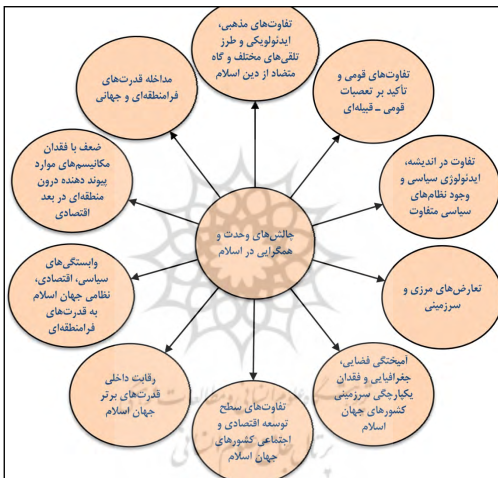
شکل ۲. عوامل و زمینه‌های واگرایی در جهان اسلام

مهم‌ترین عوامل و زمینه‌های واگرایی در جهان اسلام در قالب شکل زیر نشان داده شده است.