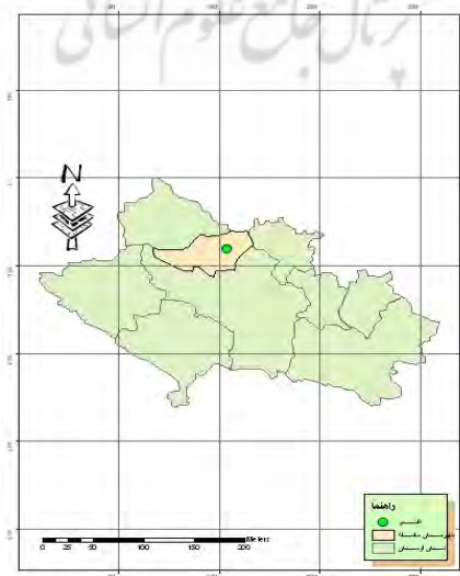
شکل ۱. موقعیت شهر الشتر در استان لرستان (ترسیم: نگارندگان، ۱۳۸۸)

الشتر شهری از شهرستان سلسله در استان لرستان است. الشتر در طول جغرافیایی 54^{\circ} 14' 48'' و عرض جغرافیایی 33^{\circ} 51' 33'' واقع شده است. این شهر، مرکز شهرستان الشتر (یا سلسله) و همچنین مرکز بخش مرکزی شهرستان الشتر نیز هست. بنابر سرشماری مرکز آمار ایران، جمعیت شهرستان الشتر در سال ۱۳۸۵ برابر با ۵۷۰۳۳ نفر بوده است. از این میان ۲۸۹۳۴ نفر مرد و بقیه زن بوده‌اند. این بخش ۱۱۹۶۴ خانوار دارد. جمعیت شهر الشتر حدود ۳۰۰۰۰ نفر است (سایت مرکز آمار ایران، ۱۳۸۹).