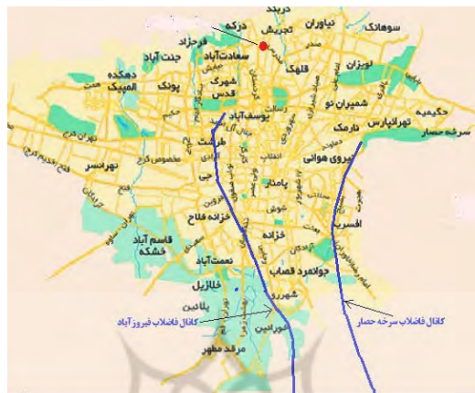
شکل ۲. مسیر کانال‌های فاضلاب فیروز آباد و سرخه حصار در شهر تهران

میدان بسیج در منتهی‌الیه جنوب شهر تهران جاری می‌شود و از آنجا وارد زمین‌های حریم جنوبی شهر می‌گردد (شکل ۲).