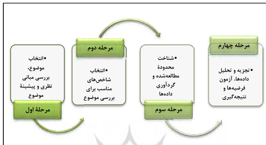
شکل ۱. فرایند انجام پژوهش