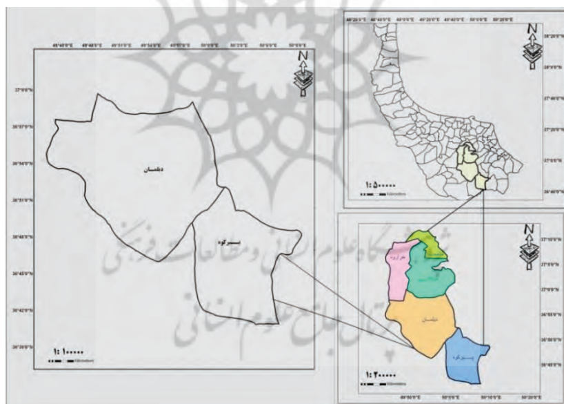
شکل ۲. موقعیت جغرافیایی منطقه مورد مطالعه

محدوده مورد مطالعه در این پژوهش، بخش دیلمان -یکی از بخش‌های شهرستان سیاهکل- است که در جنوب استان گیلان قرار دارد و از این سمت با استان قزوین هم‌مرز است. این بخش که در میان رشته‌کوه‌های البرز قرار گرفته، از دو منطقه کوهستانی- دره‌ای و جنگلی تشکیل شده است. روستاهای آن عمدتاً در منطقه کوهستانی- دره‌ای واقع‌اند و روستاهای موجود در منطقه جنگلی معدود و کم‌جمعیت هستند.