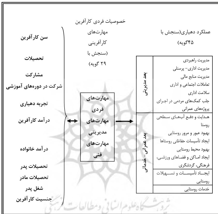
شکل ۲. مدل مفهومی تحقیق