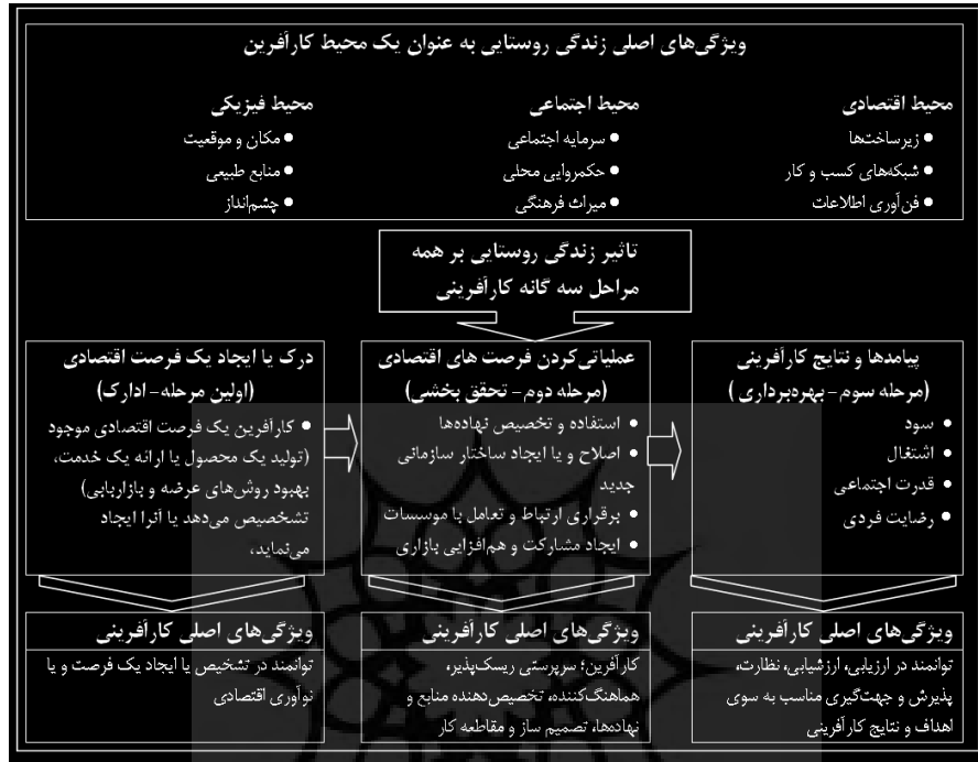
شکل ۱. فرآیندهای کارآفرینی روستایی