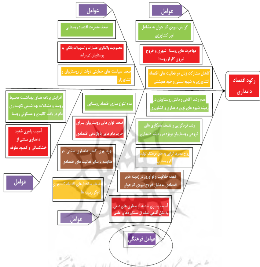
شکل ۱. مدل علت‌شناسی رکورد اقتصاد دامداری در روستاهای مورد مطالعه

سپس به منظور آگاهی از دیدگاه‌های جامعه آماری در زمینه نتایج به دست آمده از فرایند نمودار علت و معلول، پرسشنامه تحقیق بر پایه تعداد علت‌های شناسایی شده در جلسه "طوفان ذهنی" (۱۷ علت) طراحی و اجرا گردید (جدول‌های ۳ و ۴).