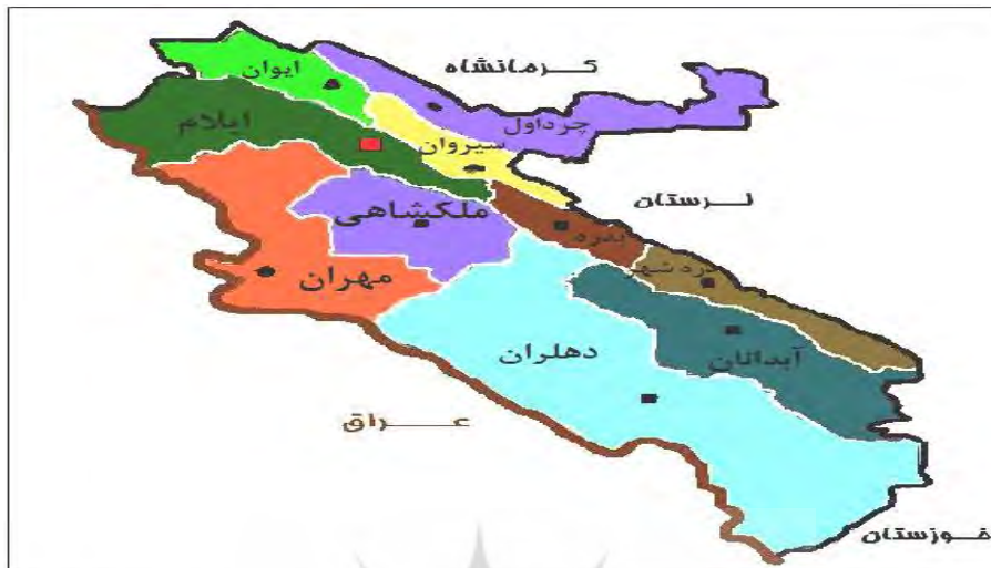
شکل 1 شکل جغرافیایی نامتعارف استان ایلام