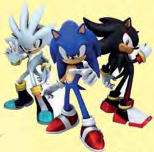
- زمینه‌ساز از خود بیگانگی

دنیای مجازی ولی نزدیک به واقعیتی که در بازی‌های رایانه‌ای به تصویر کشیده می‌شود، آن قدر مسحور کننده و جذاب است که مخاطب کودک و نوجوان در معرض تأثیر تمام باورهایی قرار می‌گیرد که از سوی طراحان این بازی‌ها به او القا می‌شود؛ در نتیجه فرد، دچار از خودبیگانگی می‌شود و مانند آنها می‌اندیشد. برای نوجوانی که در حال بازی است فرقی نمی‌کند که دشمن کیست؛ دشمن، همان است که بازی می‌گوید. در میان انبوه بازی‌های رایانه‌ای که اکنون به‌آسانی در دسترس کودکان قرار می‌گیرند، بازی‌هایی وجود دارند که در آن مسائل اعتقادی، فرهنگی، اجتماعی و سیاسی کشورهای مسلمان به‌ویژه ایران، مورد گستاخی قرار می‌گیرد.