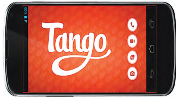
Tango Text, Voice, Video Calls

دگرگونی‌های فراوانی در مختصات فکری افراد می‌شود. ایندیویژوالیسم (Individualism) یا تفردگرایی، مهم‌ترین پدیده‌ای است که این ابزارهای رسانه‌ای و در عین حال سرگرم‌کننده با تغییر در سبک زندگی مردم، باعث گسترش آن می‌شوند.