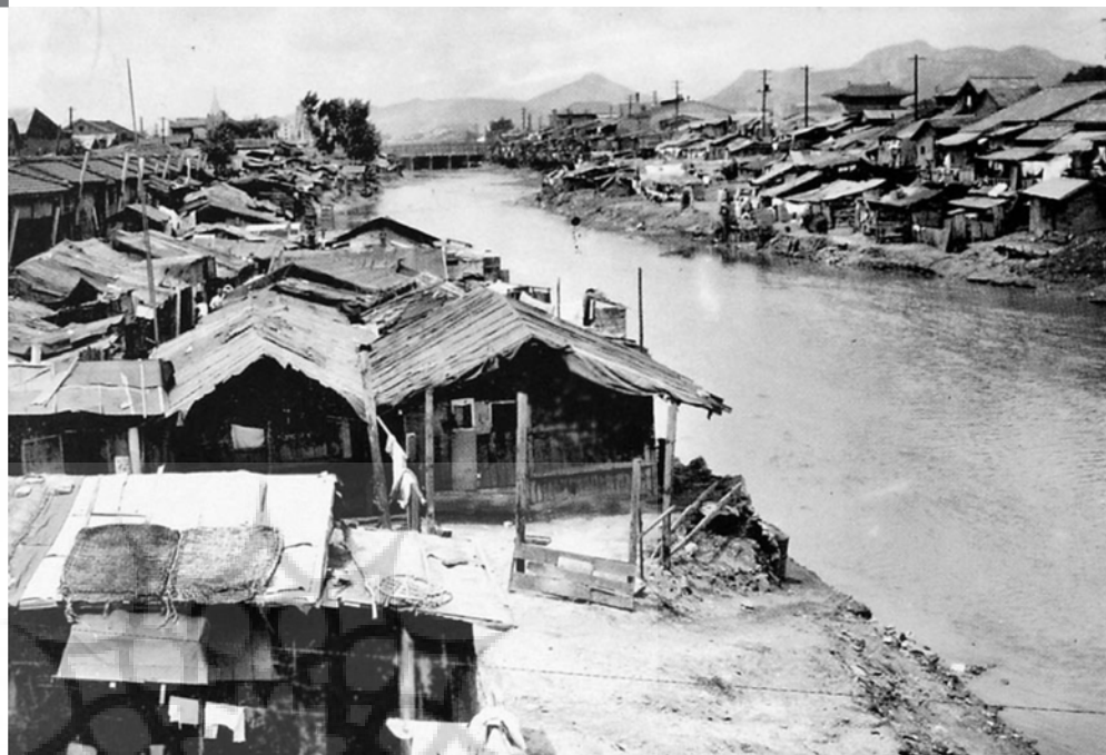
تصویر ۱۲: تصویر قدیمی رودخانه شهر سنول، عکس: مارتین بوشیه، ۱۳۹۳.

Currently, the highway is destroyed and the river is uncovered. Today, the edge of the rivers that forms an urban public space has become the venue for national ceremonies and ritual carnivals. The water is not stagnant all over its way and roaring features and waterfalls are appeared as well. Therefore, various spaces have been created by using water. Vehicles are not the main focus anymore. Pedestrians and the joy of life in the center of the city is the chief goal. Pedestrians can pass through water in some areas. The River has turned into a place for playing and having fun. Indigenous plants are used in the planting patterns. Architectural and aesthetic elements are familiar and rational to the people of Korea. Moreover, the remnant of previous bridge is kept for the continuation of history to as a reminder element in landscape. There is a canal that perhaps in other cultures do not seem. However, a curved river it is quite dominant in culture, literature, poetry and traditional Korean gardens. Martine Bouchier also added that the project was carried out over three years and is unique in its kind (Pic14 &15).