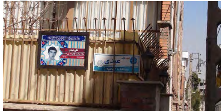
تصویر ۶: نام‌گذاری کوچه به همراه تصویر شهید، تهران. عکس: مارتین بوشیه، ۱۳۹۳.

پاسخ: زیباشناسی قابل تبدیل به کمیت نیست. یک پارک باید دارای جنبه مناسب کاربردی و پاسخگوی نیازهای مردم باشد. در مرحله اول باید نیازهای اجتماعی در پارک تأمین شود: مبلمان، گیاه، آب. سازماندهی عمومی فضای پارک و ترکیب عناصر مختلف باید کامل باشد. سپس بعد نمادین اهمیت می‌یابد. پارک‌ها باید بتوانند از طریق