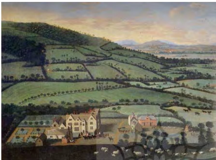
تصویر ۴ Pic4

تصویر ۴: مناطق کشاورزی انگلستان در قرن هجدهم با محوطه‌های خصوصی حصاربندی شده نمونه‌ای از رابطه بین اقتصاد و منظر را نشان می‌دهد.