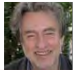
ایو لوجنبول، مدیر پژوهش‌های عالی مرکز ملی پژوهش‌های علمی فرانسه