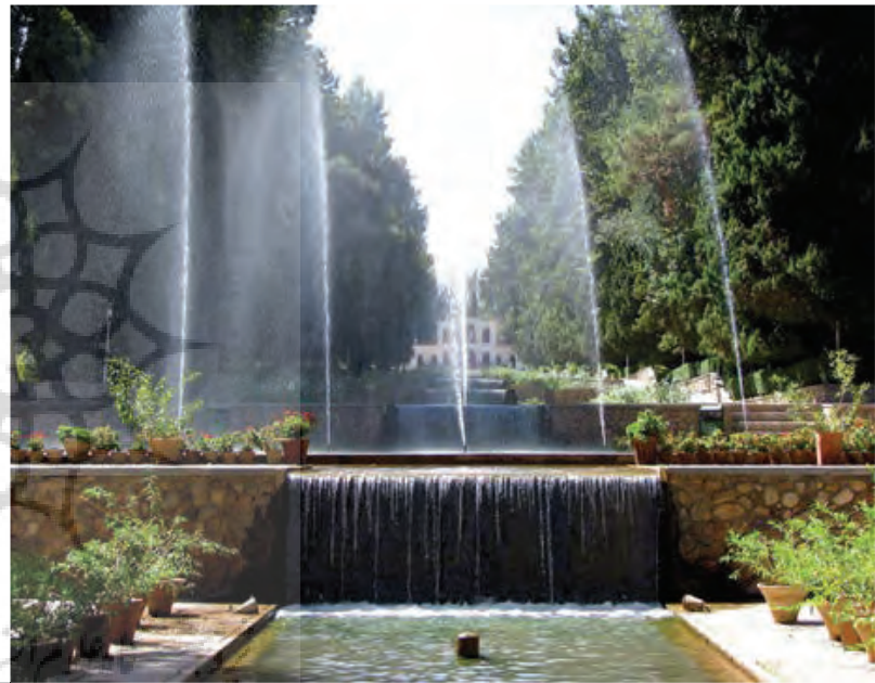
تصویر ۴ Pic4