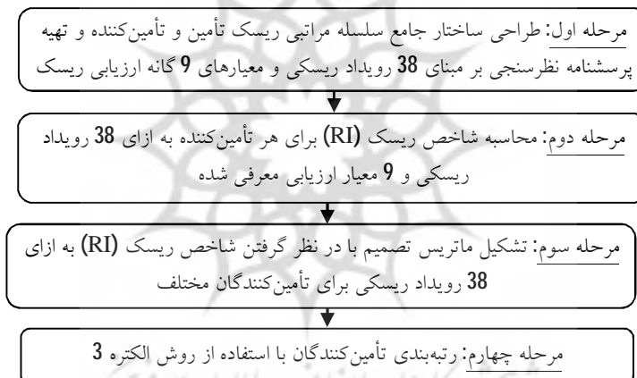
شکل 1 مراحل ارزیابی و رتبه‌بندی تأمین کنندگان بر مبنای ریسک

فرایند ارزیابی و رتبه‌بندی در قالب 4 مرحله به صورت زیر قابل انجام است (شکل 1).