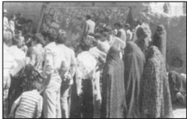
Fig. 5. Kashan, Mashhad Ardehal, performing Qali Shoyan (capet washing) Ritual. The players of this dramatic ritual are ordinary people carrying sticks (perhaps as a symbol of weapon) to show their anger about killing the Saint by the government's rulers. Source: Bolokbashi, 2000: 55.

تصویر ۴. نمایی از پرده‌خوانی در دوره پهلوی (۱۳۰۵-۱۳۵۸). مأخذ: سرسنگی، ۱۳۸۹: ۲۴۱.