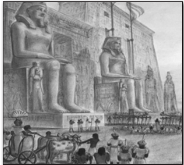
تصویر ۱. اجرای یک نمایش دسته‌روی مذهبی همراه با حمل مجسمه اوزیریس بین دو معبد لوکسور ۲۰ و کارناک ۲۱ نمونه‌ای از یک نمایش در فضای بیرونی، مأخذ: Carpiceci, 1998: 13622. Fig. 1. Performing a procession and religious play, carrying the statue of Osiris between two temples of Luxor and Karnak, as an example of performance in outdoor space. Source: Carpiceci, 1998: 136.

بنابر مستندات فوق، می‌توان چنین اذعان کرد که از دیرباز جوامع انسانی شاهد اجرای نمایش در محیط‌های بیرونی بوده‌اند؛ نمایش‌هایی که در اشکال و مقاطع گوناگون و با اهداف متفاوت اجرا می‌شده‌اند. اما نکته مهم اینجاست که اصطلاح "تئاتر خیابانی" به گونه‌ای از نمایش اطلاق می‌شود که حاصل تزیید تفکرات جدید در حوزه هنر نمایش و مربوط به جریاناتی است که آغاز آنها به قرون متأخر به ویژه اواخر قرن نوزدهم و اوایل قرن بیستم باز می‌گردد. کالین چمبرز ۲۸ در کتاب تئاتر قرن بیستم، تئاتر خیابانی را با جنبش‌های فمینیستی هنر در قرن بیستم مرتبط دانسته و می‌گوید: در اوایل قرن بیستم و با ظهور جنبش‌های اجتماعی گسترده‌ای مانند جنبشی که فمینیست‌ها در زمینه‌های مختلف سازماندهی کردند، اشکال جدیدی از تئاتر هم ظهور پیدا کرد؛ از جمله تئاتر خیابانی که نوعی تئاتر اعتراضی محسوب می‌شد. اعتراضی که هم در شکل سنت‌شکنانه آن و هم در محتوای نمایش‌ها قابل درک بود. تعداد دیگری از نظریه‌پردازان برجسته تئاتر هم درباره تئاتر خیابانی و سنت‌شکنی‌های این تئاتر مطالبی را عنوان کرده‌اند. به طور مثال برتولد به موضوعات استفاده شده در تئاتر خیابانی اشاره کرده و معتقد است مضامینی چون حقوق انسان‌ها، تبعیض در طبقه و نژاد، حقوق اجتماعی زنان، فقر و سرمایه‌داری مدرن، جنگ و نسل‌کشی