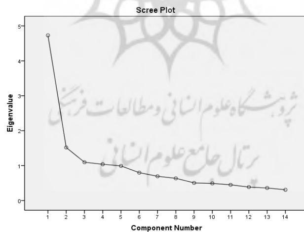
شکل ۱. آزمون اسکری برای استخراج عوامل ابزار رضایت شغلی

همان‌طور که در جدول ۳ دیده می‌شود، عامل‌های رضایت شغلی با هم رابطه معناداری دارند که این امر می‌تواند حاکی از این باشد که مدل عاملی مرتبه دوم ممکن است قابل اجرا باشد.