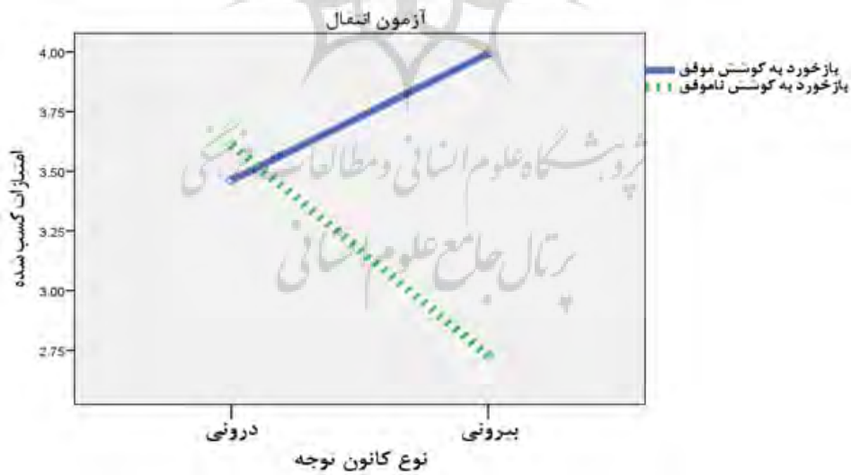
شکل ۴- میانگین امتیازات در گروه‌های بازخورد به کوشش‌های موفق و ناموفق در شرایط کانون توجه دورنی و بیرونی در آزمون‌های انتقال