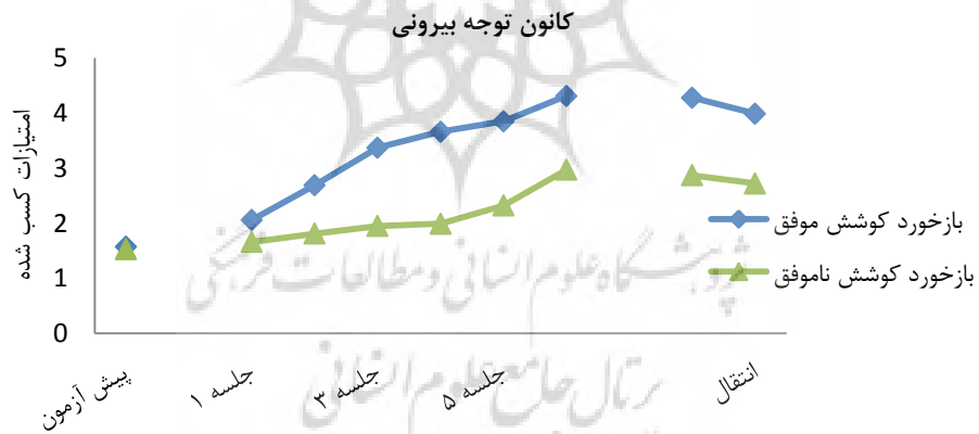
شکل ۲- میانگین امتیازات در گروه‌های بازخورد به کوشش‌های موفق و ناموفق در شرایط کانون توجه بیرونی