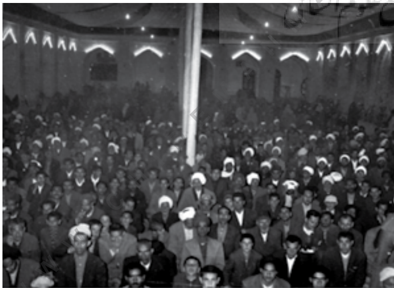
مراسم اربعین حسینی، صحن مسجد جامع یزد، منبع: مرکز اسناد میراث فرهنگی

از هم‌نشینی خانه‌ها، مسجد، بازارچه، حسینیه، آب‌انبار و... در محله‌های مختلف، به مرور زمان بافتی شکل گرفته است که قوی‌ترین نیروهای اجتماعی را می‌توان در آن مشاهده کرد. بافت تاریخی مانند جسمی است که روح جاری در آن، زندگیست. زمانی سالم است و به تعالی می‌رسد که تک‌تک اعضای آن (کوچه‌های آشتی‌کنان، خانه‌ها، میدان‌ها، لردها و...) حیات داشته باشند و آن‌طور که شایسته آن‌هاست، مورد بهره‌برداری قرار بگیرند.