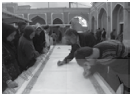
امضای طومار ثبت جهانی

بهره‌مندیم، در نظر داشته باشند که پیشنهادهای و نظراتشان وقتی می‌تواند کارساز باشد که از پایه و اساس علمی و منطقی برخوردار شود. به عبارتی، هرکسی صلاحیت ارزش‌گذاری برای ابنیه و بافت تاریخی را ندارد و این وظیفه سازمان میراث فرهنگی است. بهتر است هرکدام به وظایف خود واقف باشیم و آن را به بهترین نحو انجام دهیم. پس لازم است افرادی که خود را صاحب‌نظر در این حوزه می‌دانند، پیش از اظهار نظر دانش خود را در این عرصه بالاتر ببرند تا به درک و بینش صحیح نسبت به این موضوع مهم، دست یابند. ■