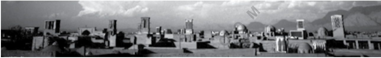
منظر شهر تاریخی یزد، عکس از محمد حسینی

و معرفی این ارزش‌ها به جهانیان. علاوه بر آن؛ با ثبت یک اثر در فهرست میراث جهانی یونسکو توجه و حمایت‌های جهانی به سوی اثر ثبت شده معطوف می‌شود.