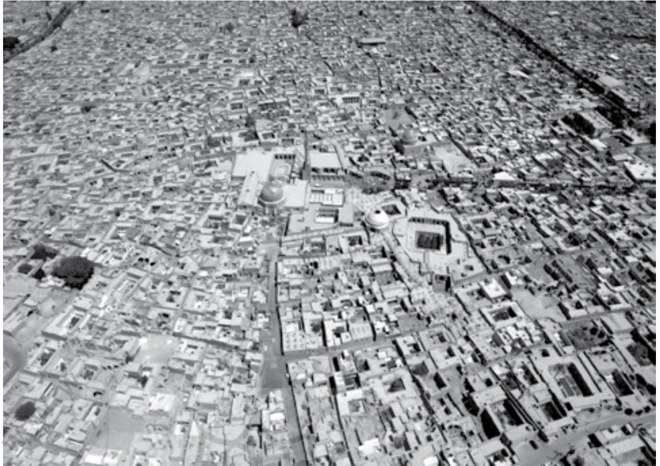
تصویر پیراگلايدر از مسجد جامع و بافت پيرامون آن، سال ۱۳۸۶