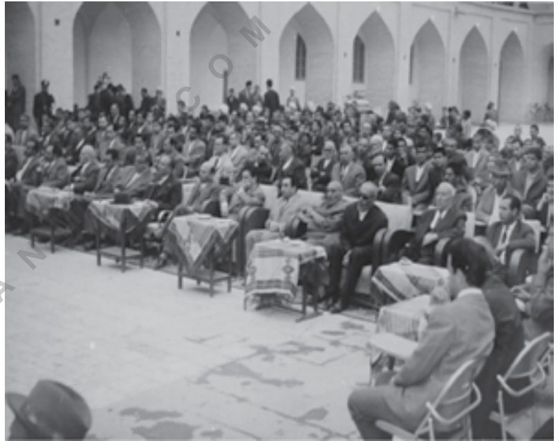
مراسمی در مسجد جامع یزد

بهره‌مندیم، در نظر داشته باشند که پیشنهادهای و نظراتشان وقتی می‌تواند کارساز باشد که از پایه و اساس علمی و منطقی برخوردار شود. به عبارتی، هرکسی صلاحیت ارزش‌گذاری برای ابنیه و بافت تاریخی را ندارد و این وظیفه سازمان میراث فرهنگی است. بهتر است هرکدام به وظایف خود واقف باشیم و آن را به بهترین نحو انجام دهیم. پس لازم است افرادی که خود را صاحب‌نظر در این حوزه می‌دانند، پیش از اظهار نظر دانش خود را در این عرصه بالاتر ببرند تا به درک و بینش صحیح نسبت به این موضوع مهم، دست یابند. ■