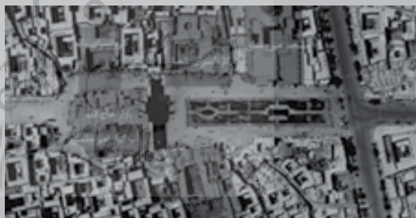
تصویر شماره ۱: عکس هوایی سال ۱۳۲۸

اولین تصویری که در کتاب‌های معماری مدرن از این مجموعه ارائه شده و باعث اختلاف گردید، تصویر جناب مهندس توسلی است که براساس عکس هوایی سال ۱۳۲۸ ترسیم گشته است. عکس هوایی مورد استناد، حاصل خرابی اطراف بوده است (تصویر شماره ۱).