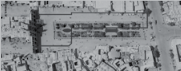
تصویر شماره ۲: نتایج حاصل از بررسی اسناد تصویری

عضو هیات علمی دانشکده هنر و معماری دانشگاه یزد