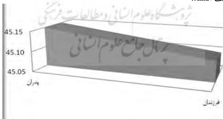
نمودار ۱. نمایش گرافیکی میزان وقوف نسل‌ها به شکاف ارزشی با نسل دیگر

جدول ۳ میانگین کلی پاسخ‌های پدران و فرزندان در مورد گویه‌ها به همراه آزمون تفاوت میانگین‌ها و دیگر آماره‌های این شاخص را به نمایش می‌گذارد. از آنجایی که فرض ما بر این است که نباید میانگین‌ها تفاوت چشمگیر داشته باشند، نباید تفاوت میانگین‌ها نیز معنادار باشد؛ چراکه در این شیوه از هر دو نسل پرسیده شده است که در هر مورد (برای مثال، معیارهای ازدواج) چقدر با دیگری اختلاف دارد و واقعیت به صورت مستقیم مورد پرسش قرار گرفته است. نتایج نشان می‌دهد: به صورت کلی در این شاخص میانگین پاسخ پدران (۴۵/۱۵) و فرزندان (۴۵/۱۰) در خصوص اختلافشان با دیگری متفاوت نیست و اندک تفاوت آشکار نیز معنادار نیست ( \text{sig} = ۰/۹۹۵ ). این نتایج با فرض نخست پژوهش مبنی بر وجود شکاف ارزشی بین نسلی در خانواده‌های تهرانی همخوانی دارد. همچنین تفسیر اعداد مذکور، این است که پدران و فرزندان به اختلاف‌های ارزشی موجود بین یکدیگر واقف هستند.