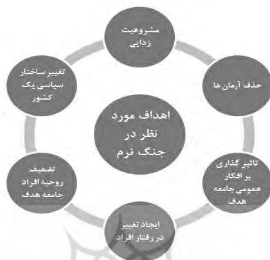
نمودار ۱. اهداف مورد نظر در جنگ نرم