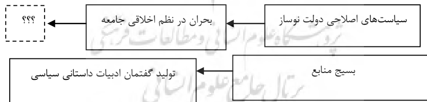
نمودار ۱. نحوه تأثیرگذاری محیط اجتماعی بر تولید گفتمان‌ها از نظر روبرت وسنو ۲

دومین دسته، شامل مراحل «تولید»، «گزینش» و «نهادینه‌شدن» است (مهرآئین، ۱۳۸۶: ۵۹). در مرحله تولید، اندیشه‌ها صورت‌بندی و پردازش می‌شوند، موعظه‌ها ایراد می‌شوند، گفتمان‌ها به وجود می‌آیند، کتاب‌ها و جزوه‌ها نوشته می‌شوند، دوره‌های درسی تدریس می‌شوند و روزنامه‌ها تولید می‌شوند. در مرحله دوم، هنگامی که میزان زیادی از محصولات و تولیدات فرهنگی آفریده شدند، فرایند گزینش آغاز می‌شود. در این مرحله، نویسندگان برخی ژانرها را برمی‌گزینند و بقیه را کنار می‌گذارند و اشکال جدید اندیشه، جایگزین اشکال قدیمی‌تر می‌شود. برخی منابع به سمت انواع خاصی از ایدئولوژی جاری می‌شوند. در مرحله پایانی، سازوکارهای معمول برای تولید و اشاعه اشکال خاصی از گفتمان به وجود می‌آیند. برخی نویسندگان، به دلیل سبک ادبی خاصشان، شناخته و مشهور می‌شوند؛ صورت‌ها و فرم‌هایی که یک ایدئولوژی در قالب آن‌ها ابراز و بیان می‌شود، رایج‌تر و متداول‌تر می‌شوند؛ نشریات و فعالیت‌های انتشاراتی به حرکت درمی‌آیند؛ تشکیلات و سازمان‌های تولیدکننده فرهنگ از کنترل بیشتری بر راه‌های دستیابی‌شان به منابع برخوردار می‌شوند و در ایجاد نظام‌های پاداش و انتظار خود مستقل‌تر می‌شوند و در نتیجه یک ایدئولوژی به مؤلفه‌ای نسبتاً ثابت از ساختار نهادی جامعه مورد نظر تبدیل می‌شود (وسنو، بی تا: ۷۲).