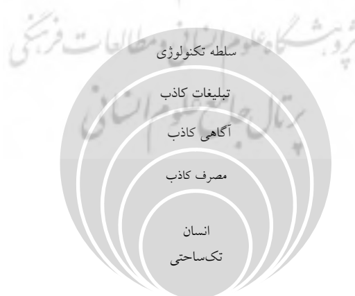
شکل ۱. هژمونی تکنولوژی بر جامعه از نگاه مارکوزه

مارکوزه در مقاله خود با عنوان «برخی کارکردهای اجتماعی تکنولوژی مدرن (۱۹۴۱)» این بحث را مطرح می‌کند که تکنولوژی در عصر حاضر در حال سازماندهی و تغییر روابط اجتماعی و ارائه‌کننده افکار و الگوهای رفتاری و ابزاری برای کنترل و سلطه شده است. در حوزه فرهنگ، تکنولوژی باعث ایجاد فرهنگ توده می‌شود که افراد را در الگوهای مسلط فکری و رفتاری گرفتار می‌کند. بنابراین، ابزار قدرتمندی برای کنترل اجتماعی و سلطه می‌سازد (کلنر، ۱۳۸۶).